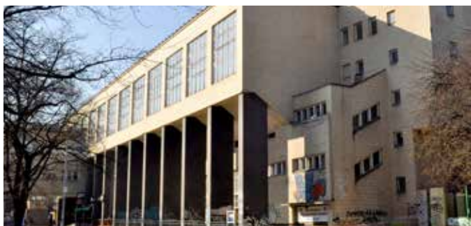
Vinohradská sokolovna (MČ Praha 2)

Uvnitř budovy se nachází bronzová socha Miroslava Tyrše od Ladislava Šalouna, která zde byla slavnostně umístěna v roce 1947. Jde o jednu z kopií původní sochy vytvořené pro Tyršův dům. Najdeme zde i pamětní desky připomínající významné členy Sokola, kteří se zapojili do protinacistického odboje, jako byli generál Hugo Vojta, Alois Eliáš a další. Ze starších členů vinohradského sokola lze uvést i operní pěvkyni Jarmilu Novotnou nebo vítěze berlínské Olympiády 1936 ve cvičení na kruzích, Aloise Hudce.