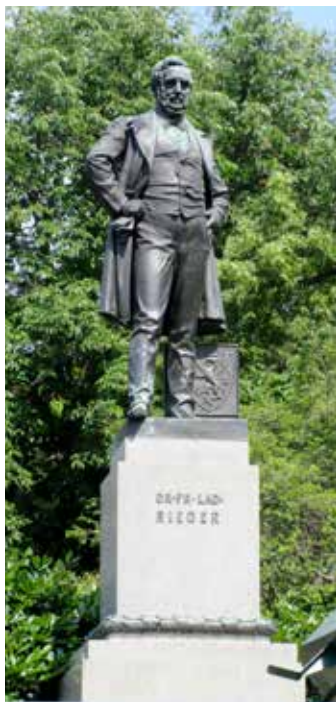
Pomník Františka Ladislava Riegra

František Ladislav Rieger (1818–1903) byl jednou z nejvýznamnějších českých osobností 19. století, politik a národohospodář, poslanec Českého zemského sněmu za Národní (staročeskou) stranu a poslanec Říšského sněmu ve Vídni. Stýkal se s českými vlastenci a do politiky se zapojil v revolučním roce 1848. Byl dlouholetým spolupracovníkem Františka Palackého a oženil se s jeho dcerou Marií. Byl zastáncem umírněné politiky ve vztahu k Vídni i v česko-německých vztazích. Téměř čtyřicet let byl čelním představitelem strany staročeňů, která byla až do r. 1891 vedoucí českou stranou.