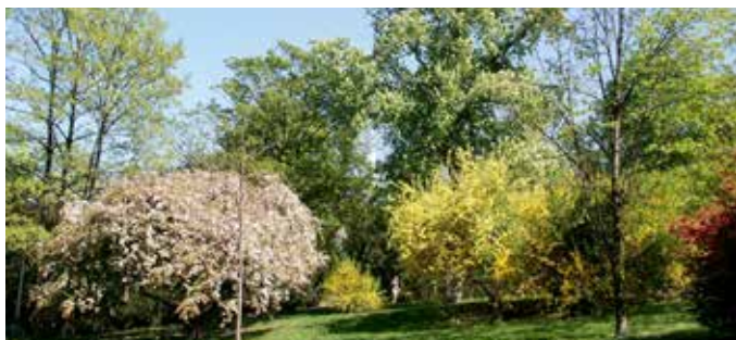
Zeleň v Riegrových sadech (M. Polák)