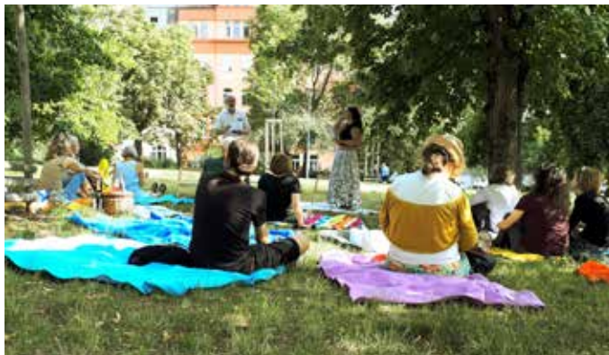
Dvojka literární: Piknik s Máchou (MČ Praha 2)