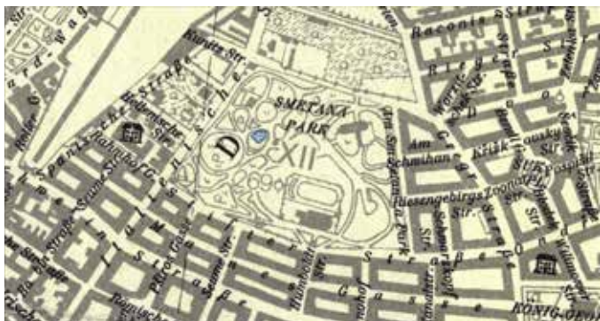
Riegrovy sady, mapa 1944 (MČ Praha 2)