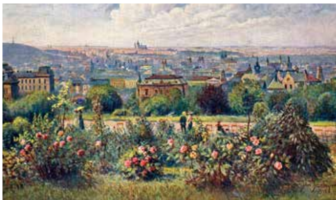
Výhled z Riegrových sadů, pohlednice, po r. 1919 (M. Frankl)

Riegrovy sady jsou parkem anglického typu. Nacházejí se na území Vinohrad. Sady byl zřízeny na nezastavěné části někdejší zahrady Kanálky, kterou vybudoval Josef Emanuel hrabě Canal de Malabaila na přelomu 18. a 19. století. Vykoupil pozemky za městskými hradbami, kde se od středověku nacházely vinice a usedlosti. Ve velkoryse vybudovaném areálu byly zahrady, sady, jezírka, vodotrysky, zvěřinec, budovy určené pro vědu i odpočinek a další objekty.