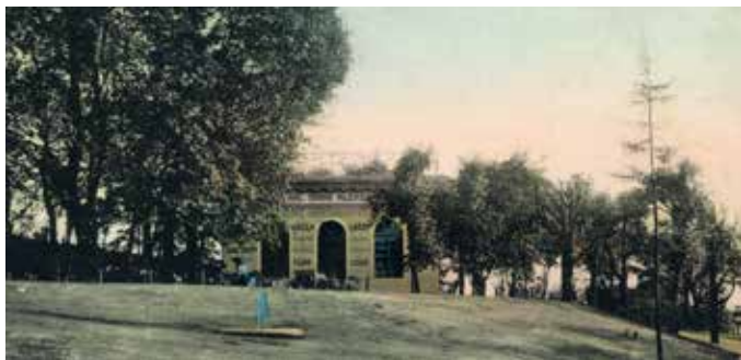
Gloriet patřící k usedlosti Saracinka, pohlednice (M. Polák)

Budova restaurace Mlíkárna s vyhlídkovou plošinou stojí v místě někdejšího gloriety patřícího k usedlosti Saracinka (Vozová). Ve 20. letech 19. století byl vybudován objekt s rozhlednou. Uvádí se, že název odkazuje na období, kdy zde byla umístěna cukrárna nabízející mléčné a jogurtové výrobky. Podle dobové pohlednice je patrné, že Mlíkárnu provozovala První česká akciová parní mlékárna, tedy Nuselská mlékárna, a nabízela zákazníkům i léčivé minerální vody, led a byl zde i výčep a další občerstvení. Mlíkárna byla v provozu do roku 1956 a pak byla využívána jako zahradní sklad. Vzrostlé stromy přerostly vyhlídkovou plošinu a stavba chátrala, až se z ní stala ruina.