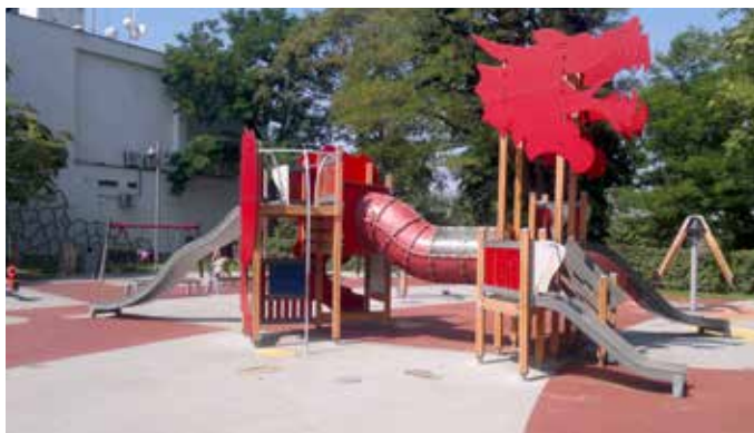
Dětské hřiště U Draka (MČ Praha 2)

Dřevěný pavilon vedle restaurace, který za první světové války sloužil jako lazaret a později tělocvična, byl zrušen a na volné ploše vzniklo dětské hřiště. Dnes jej známe jako hřiště U Draka s množstvím atrakcí včetně centrální prolézačky se skluzavkou ve tvaru draka. V roce 2008 Praha 2 hřiště komplexně rekonstruovala. O deset let později zde byla instalována i lavička Jaroslava Foglara.