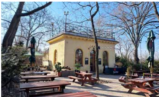
Restaurace Mlíkárna (MČ Praha 2)

Na konci 20. století se začalo uvažovat o její renovaci, protože již byla považována za kulturní památku. V prvním desetiletí tohoto století byla nájemcem provedena citlivá rekonstrukce a napojení na inženýrské sítě. Zahradní restaurace s vyhlídkovým pavilonem byla otevřena r. 2009. Dnes je opět vyhledávaným místem pro posezení a občerstvení. Jen za vyhlídkou na Prahu je třeba kvůli vzrostlým stromům přejít na nedalekou stráň.