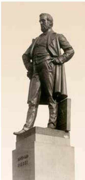
Pomník Františka Ladislava Riegra, kol. 1920