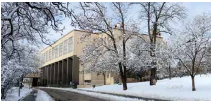
Vinohradská sokolovna (MČ Praha 2)