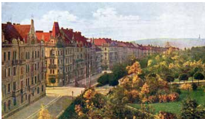
Vstup do Riegrových sadů z Nerudovy ulice (Polská), pohlednice, okolo 1920 (M. Frankl)

Na dobu hraběte Canala upomíná trojboký obelisk, který nechal postavit na památku své zesulé ženy. Původní areál se rozprostíral zhruba od dnešního Národního muzea k náměstí Jiřího z Poděbrad, nedochoval se však v původním rozsahu. Při výstavbě Královských Vinohrad představitelé města získali část pozemků pro obec a určili je pro městskou zeleň. Zdejší městský sad byl pojmenován podle Františka Ladislava Riegra. Během nacistické okupace byly sady pojmenovány po Bedřichu Smetanovi, avšak po válce získaly opět svůj původní název.