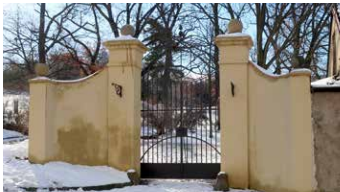
Brána z Vozové ulice (M. Polák)

Brána do Riegrových sadů v ulici Vozová nedaleko Italské ulice na samé hranici městských částí Praha 2 a Praha 3 je pozůstatkem vjezdu do zahrady usedlosti Saracinka. Od 15. století zde byla usedlost s vinicí, kterou v polovině 19. století přestavěl hrabě Reichenbach Lessoni na vilu se zahradou. Právě vjezd do této zahrady se dochoval do dnešních dnů jako brána do Riegrových sadů.