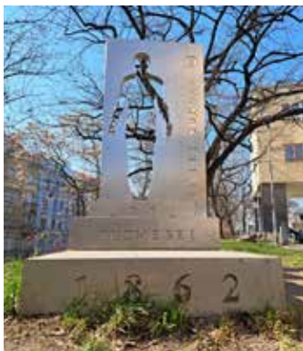
Pomník ke 150. výročí Sokola (MČ Praha 2)