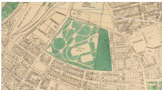
Riegrovy sady, mapa 1909 – 1914 (MČ Praha 2)