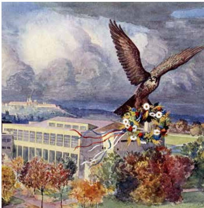
Otakar Štáfl: Nová sokolovna vinohradská, kol. 1945 (MMP, H 247 227)

Vinohradská sokolovna je jednou z největších funkcionalistických staveb v Praze a největší sokolovnou. Sokol byl na Královských Vinohradech založen v roce 1887, tedy devět let po jejich povýšení na město. Byl od počátku významným centrem kulturně společenského života a tělovýchovy. Vinohradští sokolové však cvičili v různých pronajatých prostorách a na splnění snu o vlastní tělocvičně si museli mnoho desetiletí počkat.