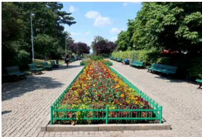
Promenáda v Riegrových sadech (M. Polák)

V Riegrových sadech najdeme několik zajímavých budov. Na místě někdejší usedlosti Švihanka stával tzv. Štastného hostinec, který byl na začátku třicátých let moderně přestavěn a od roku 1934 se mu podle majitele říkalo Šretrova restaurace. Na konci minulého století byl objekt upraven pro administrativní účely. V sousedství je dnešní dětské hřiště U Draka. Jinou starší stavbou je restaurace Mlíkárna s vyhlídkovou plošinou. Stojí v místě někdejšího gloriety patřícího k usedlosti Saracínka (Vozová), na kterém byl ve 20. letech 19. století vybudován objekt s rozhlednou. Zbytkem po téže usedlosti je i vstupní brána z ulice Vozová. Park jako celek je památkově chráněn od roku 1958.