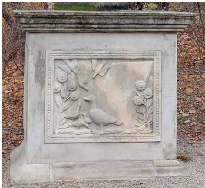
Obelisk, reliéf na podstavci (M. Polák)