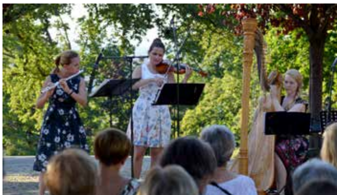
Hudební léto v parcích (M. Pochman)

Malebné prostředí Riegrových sadů s jedinečnou vyhlídkou na Prahu je hojně využíváno návštěvníky všech generací, kteří sem přicházejí za odpočinkem, na procházku, zasportovat si nebo vyvenčit psa. V létě s výhodou využívají možnost občerstvení na čerstvém vzduchu. Koná se zde i množství akcí. Praha 2 zde pořádá sportovní či osvětové akce pro školy a rodiče s dětmi, koncerty cyklu Hudební léto v parcích, setkání s literaturou. Za hudbou či sportovními přenosy lze zajít také do restaurace PARK Riegrovy sady. Rovněž na atletickém stadionu u sokolovny, kde se mj. natáčel film Zátopek, lze nejen sportovat, ale také navštívit různé kulturní a společenské akce určené pro větší množství lidí. Park je využíván i jinými subjekty pro venkovní výstavy, letní filmové projekce, setkání, prezentace a jiné kulturní, společenské a sportovní akce. Při návštěvě parku si lze připomenout zajímavou historii zdejší části Vinohrad. Samozřejmě by pak měla být vzájemná ohleduplnost a úcta k zeleni i mobiliáři, za kterou se bral již zakladatel parku Leopold Batěk.