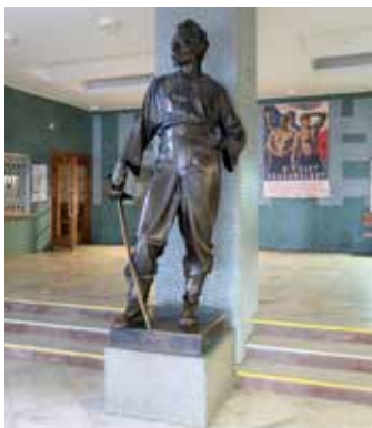
Socha M. Tyrše v hale (MČ Praha 2)