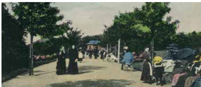
Promenáda v Riegrových sadech, pohlednice (M. Polák)

V roce 1902 získaly sady jméno podle Františka Ladislava Riegra a roku 1904 pověřilo město dalšími pracemi zahradního architekta Leopolda Batěka (1869–1928), který se stal ředitelem městských sadů. Batěk byl uznávaným a úspěšným odborníkem. Stal se i vrchním pražským zahradníkem, předsedou Zemské jednoty českých zahradníků, založil odbornou zahradnickou školu, organizoval výstavy a psal odborné i popularizační publikace. Navrhl a založil na 200 parků a zahrad doma i v zahraničí. V Praze 2 kromě Riegrových sadů (1904–1908) navrhl úpravu parku na nám. Míru (1911) a podílel se na rekonstrukci sadů Svatopluka Čecha.