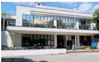
Zahradní restaurace v Riegrových sadech, kol. 1930 (MMP, HNX 000 472)