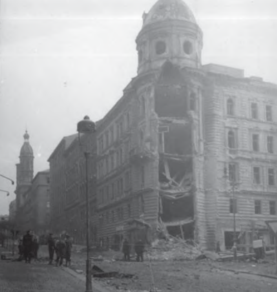
Roh Slezské a Sázenské