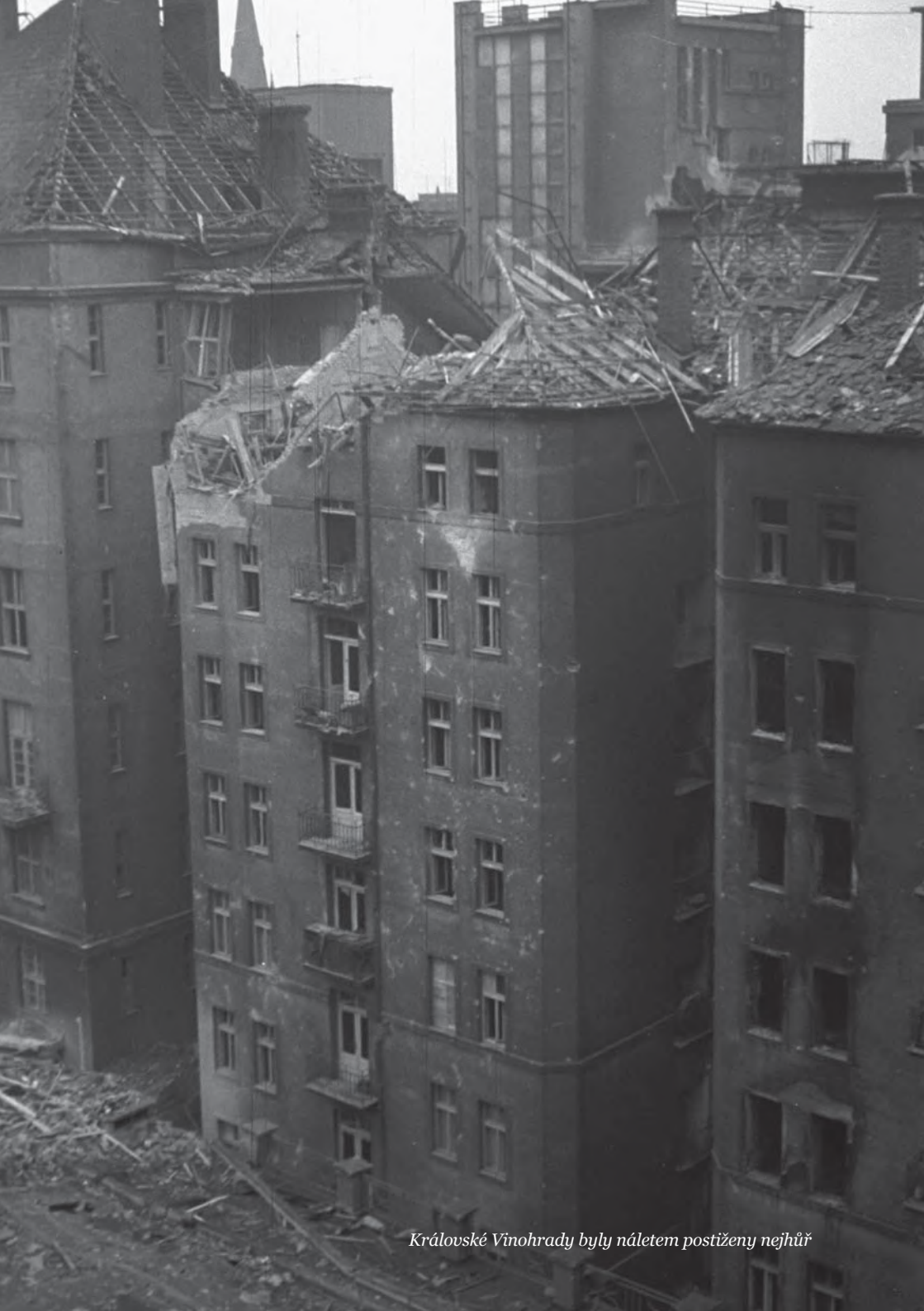
Královské Vinohrady byly náletem postiženy nejhůř