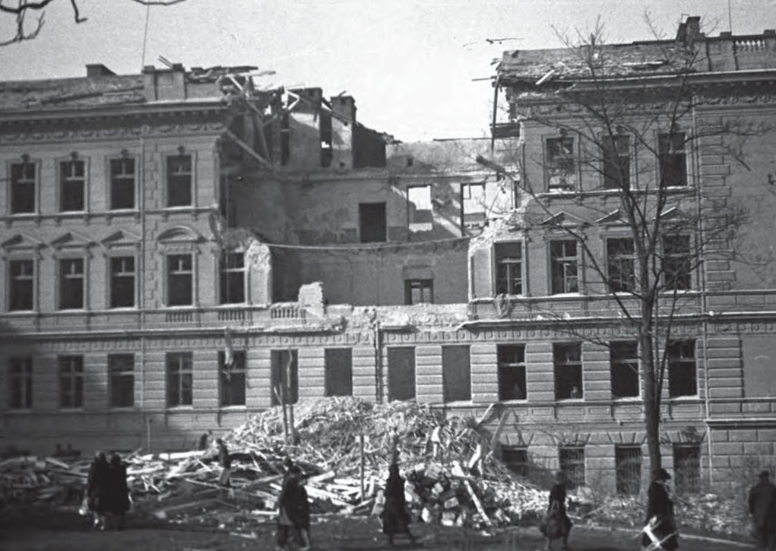
Vinohradská ulice po náletu

Opravdu to byl zázrak, že maminka nepřišla o život. Tatínek s dědečkem byli v práci a byli rádi, že jsme to všichni přežili. Chtěla bych poděkovat babičce, která už nežije, že nám svou duchapřítomností zachránila život.