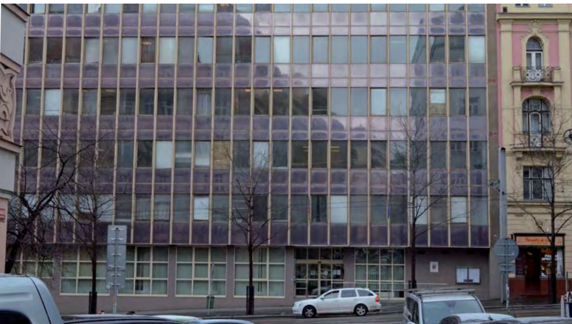
Dnes zde stojí budova Finančního úřadu Prahy 2