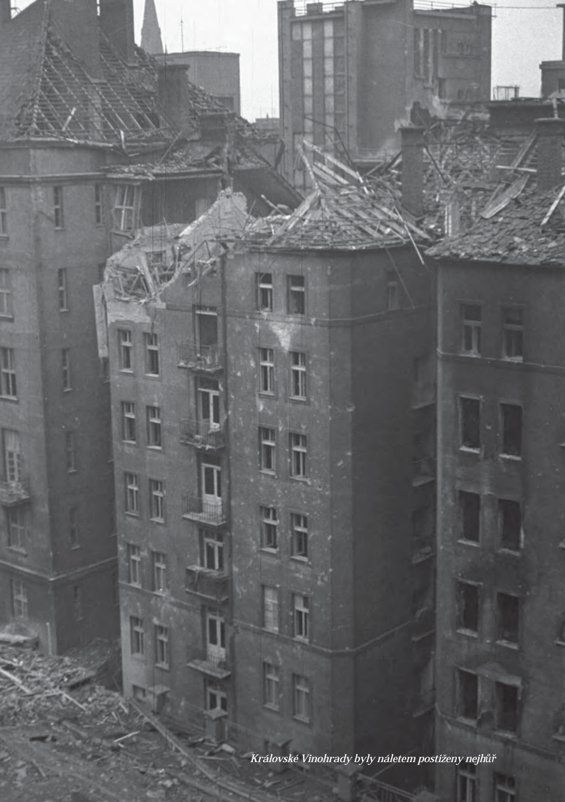
Královské Vinohrady byly náletem postiženy nejhůř