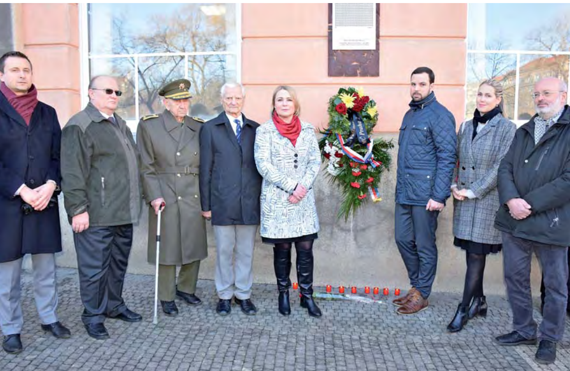
Představitelé městské části Praha 2 vzpomínají na oběti náletu u pamětní desky na Všeobecné fakultní nemocnici každoročně

Kluk seděl v otevřeném okně podkrovního pokoje a vyhlížel letadla. Nebyl ve škole, už nějakou dobu se neučilo, ve škole teď bydleli vojáci. Táta vzhlédl od verpánku, kde si přivydělával opravováním bot, a podíval se z okna taky. Nebyli ještě vidět, ale byli slyšet, víc než obvykle. Máma zadělávala těsto na buchty a tvářila se ustaraně.