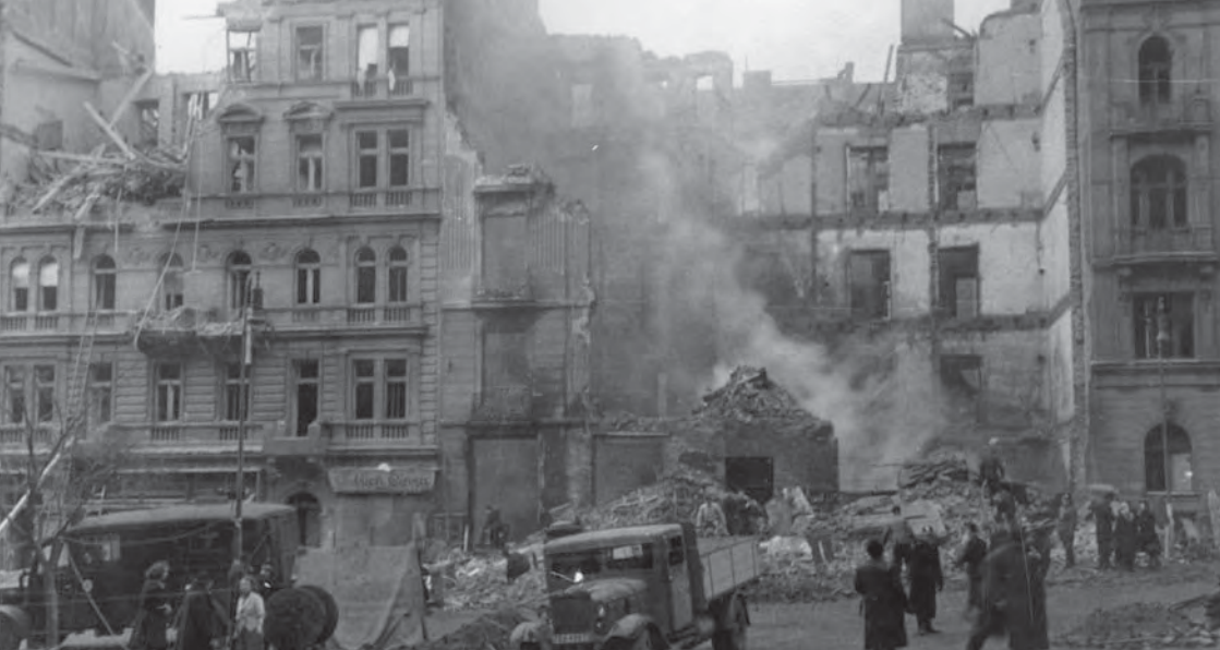
Vinohradská třída u ústí Sázavské