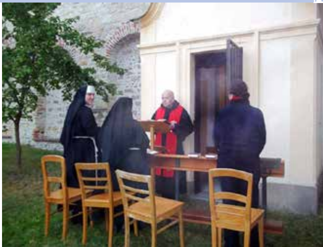
Mše svatá v kapli sv. Václava v klášterní zahradě, rok 2011.

nízký nájem daný nevýhodnými smlouvami, který nestačil ani na údržbu budov. Potíže vyvrcholily v roce 2016, kdy provoz skončil s milionovými dluhy a reálně hrozilo, že nemocnice po třech stoletích zanikne. V roce 2019 se sestrám po složitých jednáních podařilo získat provoz nemocnice zpět; novým provozovatelem se stala společnost Sv. Alžběta na Slupi zřízená konventem alžbětinek. Areál i provoz nemocnice jsou tak nyní ve stejných rukou jako před 300 lety. V současné době nese toto církevní zdravotnické zařízení jméno Nemocnice sv. Alžběty Na Slupi , není už určeno výhradně ženským pacientkám, ale poskytuje následnou lůžkovou péči a ambulantní péči pro pacienty z Prahy a okolí, a to nejen v oblasti lékařské, ale i psychologické, sociální a duchovní.