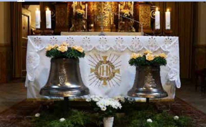
Požehnání nových zvonů pro klášterní kostel v červnu 2019: vlevo sv. Alžběta, vpravo Panna Maria Bolestná.