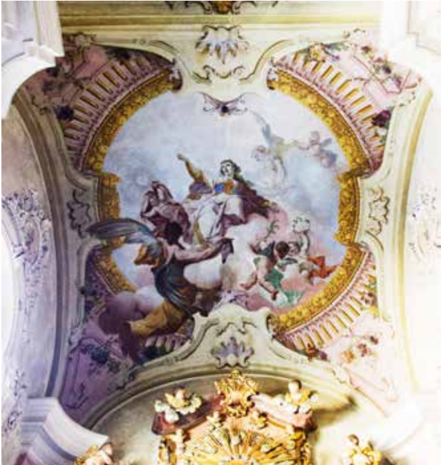
Freska Oslavení sv. Tekly na klenbě nad oltářem

malby citlivě vkomponovány a dotvářejí komorní charakter kaple se zachováním výtvarné působivosti.