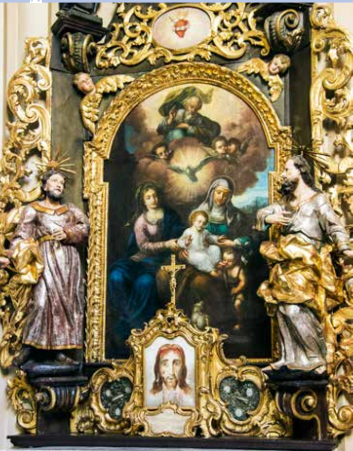
Skupina Rodiny Páně na oltáři sv. Anny: Na obraze Panna Maria a sv. Anna s malým Ježíškem a sv. Janem Křtitelem (nad nimi Duch Svatý a Bůh Otec), po stranách sochy sv. Josefa a sv. Jáchyma