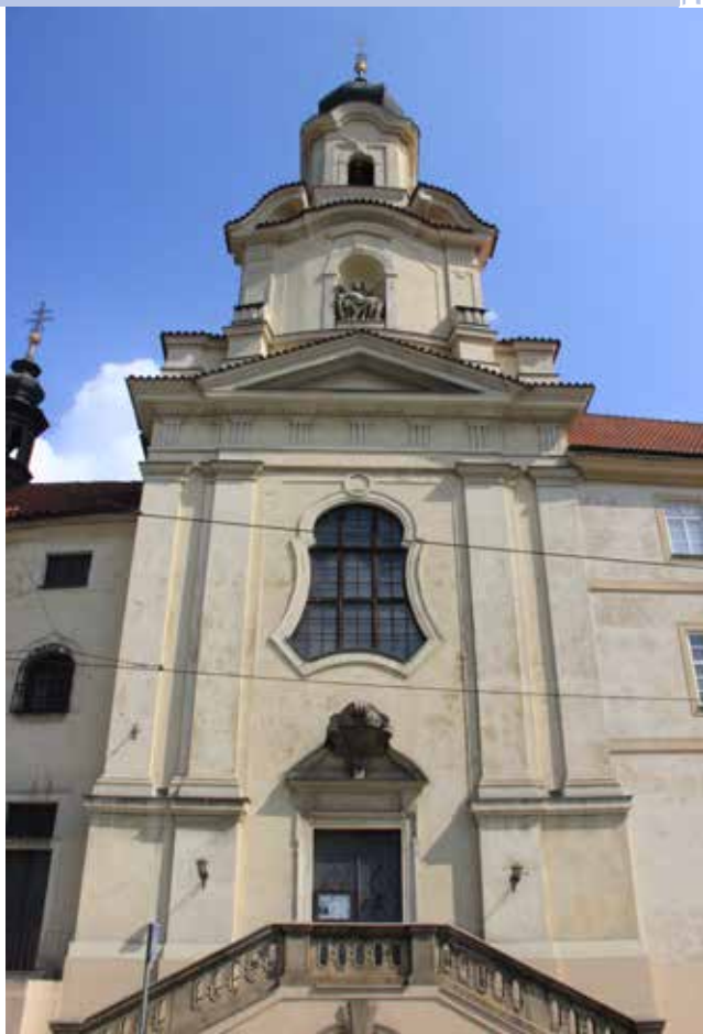
Průčelí kostela do ulice Na Slupi