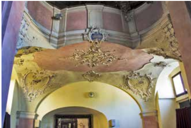
Varhanní kruchta kaple sv. Tekly

Stěny kaple jsou vyzdobeny četnými štukovými rokokovými ozdobami s motivy rokajů. Pastelově laděné odstíny omítky jsou doplněny květinovým dekorem na sloupech. Drobné modré květy v kombinaci se starorůžovou barvou omítky působí romanticky a jejich dekorativnost obzvláště vyniká na malbě v prostoru kolem oltáře.