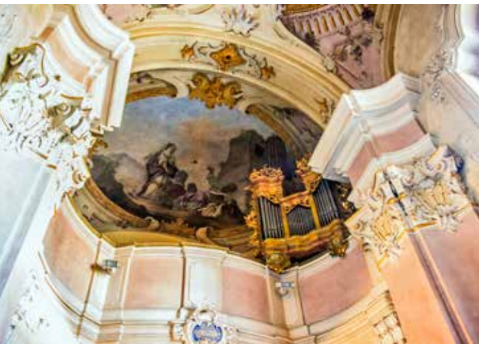
Freska Vyučování sv. Tekly sv. Pavlem na klenbě nad kruchtou

Výmalbu kaple doplňují tři freskové obrazy ze života sv. Tekly. Jejich autorem je Jan Lukáš Kracker, v té době nejuznávanější pražský malíř, který proslul především freskami. Pocházel z Vídně, kde se mu dostalo i malířského vzdělání, navštěvoval tam jedenáct let Akademie. Své vrcholné dílo však vytvořil v Praze v kostele sv. Mikuláše na Malé Straně, kde v letech 1760–61 malířsky ztvárnil nejrozměrnější klenební plochu v českých zemích. A záhy poté dostal zakázku na výmalbu kaple sv. Tekly, což je pozoruhodný kontrast; oproti práci ve sv. Mikuláši, kde dostal umělec maximální prostor, musel se u sv. Tekly vypořádat s mnohem omezenějším měřítkem. Nebyl tu prostor pro monumentalitu, ale přesto jsou i do takto malého prostoru