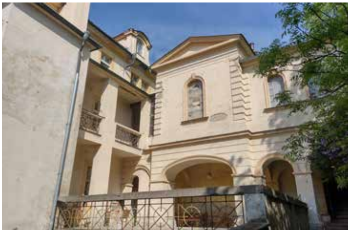
Jižní průčelí novorenesanční umrlčí komory od architekta Karla Hübschmanna z roku 1895

K východní straně nemocničních budov v zahradě přiléhá historizující přístavba márnice od architekta Karla Hübschmanna z roku 1895. Obdélná stavba s přístupovým jednoramenným schodištěm je postavena v novorenesančním stylu a zajímavým způsobem se vypořádává s rozdílnou výškou okolního terénu.