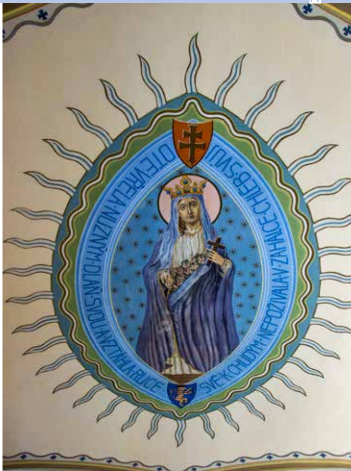
Stropní malba svaté Alžběty