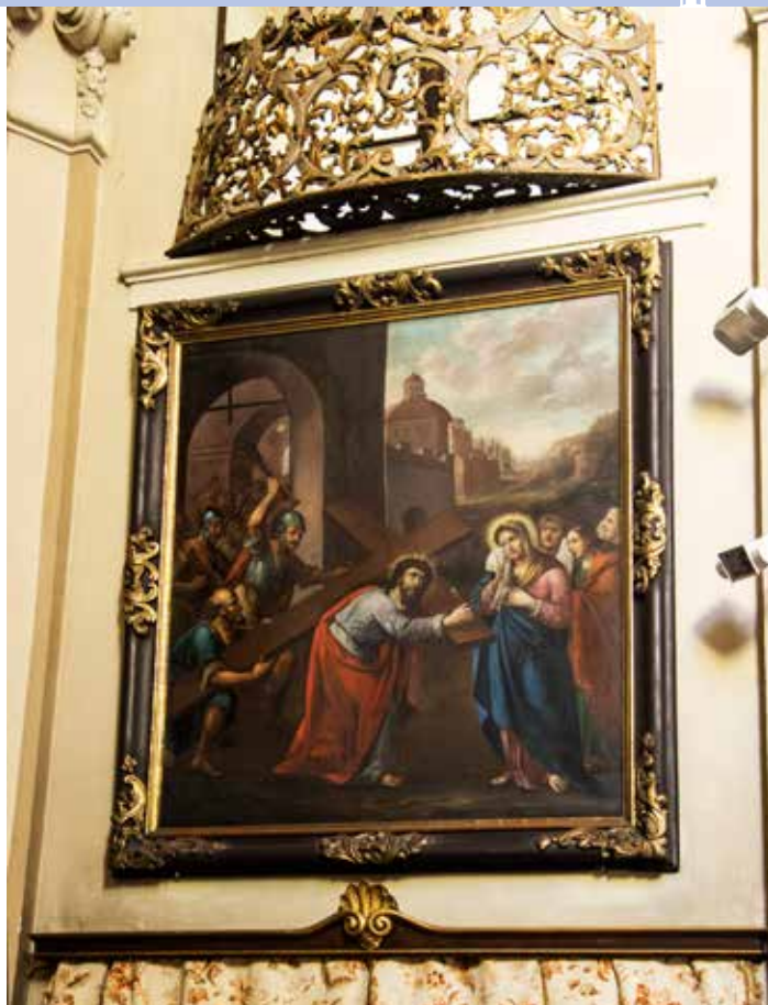
Obraz Kristovo setkání s Marií na křížové cestě zavěšený na jižní stěně presbytáře