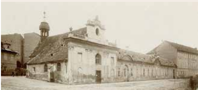
Kostel sv. Bartoloměje s městským chudobincem ve Vyšehradské ulici, kolem roku 1890 (před zbořením).

Charitativní instituce mají v této části Nového Města dlouhou a bohatou historii. Nedaleko odsud, mezi ulicemi Na Slupi a Vyšehradská, na místě dnešní budovy Ministerstva spravedlnosti, zakoupila roku 1505 novoměstská obec dům a zřídila tu městský špitál, u něhož byl postaven gotický kostel sv. Bartoloměje (podle některých zdrojů už předtím v těch místech fungoval klášter sv. Bartoloměje, založený královnou Eliškou Přemyslovnou). Krátce po svém zřízení byl špitál správně sloučen s vyšehradským špitálem sv. Alžběty, který se nacházel poblíž ústí říčky Botič do Vltavy. Špitál byl v 17. a 18. století rozšiřován a roku 1773 byl kostel barokně přestavěn. Za císaře Josefa II. byl špitál zrušen a kostel uzavřen. Původní plán uzpůsobit budovy na ústav pro choromyslné se neuskutečnil a nakonec zde byl počátkem 19. století zřízen městský chudobinec. Kostel sv. Bartoloměje byl tehdy obnoven, časem však přestal chudobinec kapacitně vyhovovat, a tak byl i s kostelem v roce 1884 stržen a na jeho místě byla postavena trojkřídlá novorenesanční novostavba podle návrhu architekta Josefa Srdínka. Chudobinec zde sídlil až do roku 1928, dnes budovu využívá Ministerstvo spravedlnosti ČR.