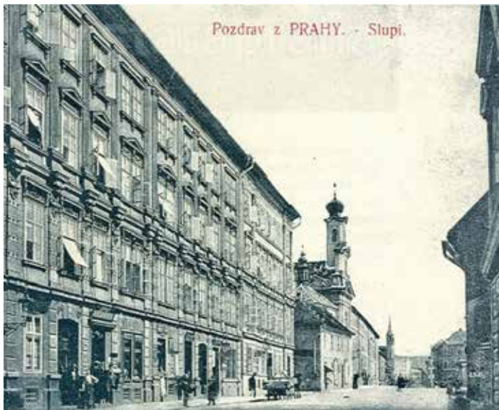
Ulice Na Slupi na pohlednici z roku 1908