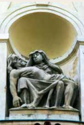
Socha Piety ve výklenku na průčelí kostela

Připomínaných sedmero Mariiných bolestí představuje život naplněný utrpením, kterým se podílela i na úkolu svého syna jakožto Spasitele. Všechny jmenované bolesti provází Mariin vnitřní souhlas a důvěra v Boha, což je pro křesťany vzorem toho, jak dávat svému utrpení smysl odhodlaným spojením s obětí Krista.