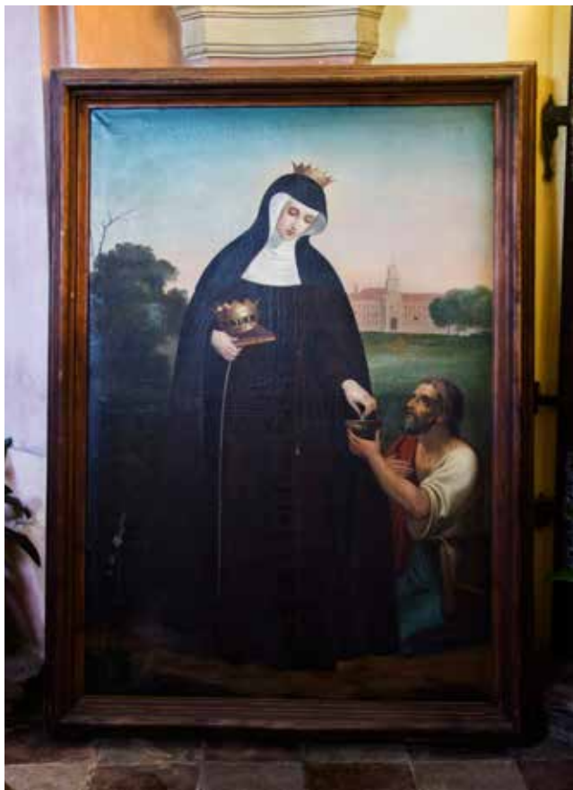
Obraz sv. Alžběty, vystavený u příležitosti 300. výročí založení pražského kláštera v kapli sv. Tekly