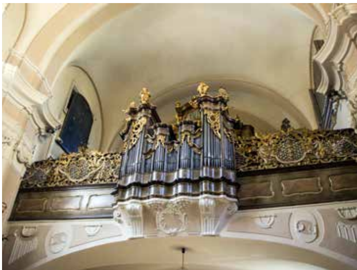
Varhanní kruchta se štukovou dekorací, rokokovým dřevěným zábradlím a varhanami

Oratoře kolem presbytáře kryjí krásně řezané rokokové mřížky z doby kolem roku 1770, částečně důmyslně skryté za sochařskou výzdobou hlavního oltáře.