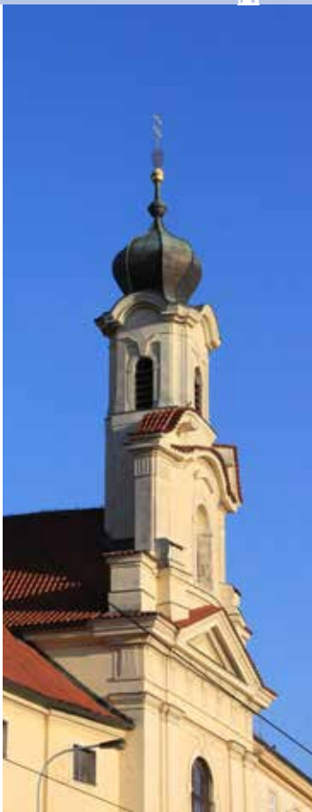
Horní část průčelí kostela se štítem a štíhlou věžičkou

Před portál je představeno dvouramenné novobarokní schodiště s kamennou