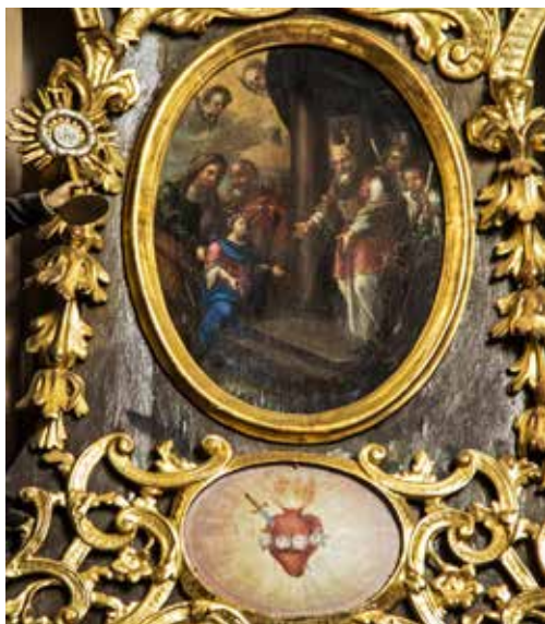
Obraz Obětování Panny Marie, pod ním Neposkvrněné Srdce Panny Marie

V nástavci bohatě zdobeném pásovými ornamenty je malý obraz Neposkvrněného srdce Panny Marie a nad ním oválný obraz Obětování Panny Marie: sv. Anna se sv. Jáchymem přivádějí svou dceru Marii do jeruzalémského chrámu, kde ji přijímá kněz. Po stranách obrazu stojí sochy řádových světic sv. Kláry s monstrancí a knihou a sv. Růženy z Viterba s růží, nad nimi dva andělíčky. Na vrcholovém baldachýnu pak stojí socha sv. Barbory, držící v ruce kalich s hostií. Sv. Barbora je mimo jiné patronka umírajících a je vyzývána proti moru a horečnatým onemocněním.