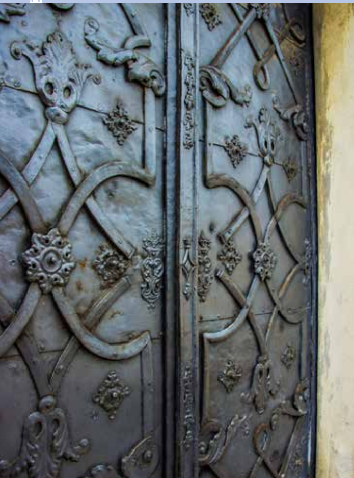
Detail pásových ornamentů na vstupních dveřích do kaple sv. Tekly