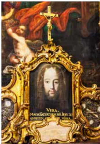
Tvář Kristova (Abgarův obraz) na oltáři sv. Jana Evangelisty

Vpravo stojí oltář sv. Jana Evangelisty. Hlavní obraz zachycuje sv. Jana na ostrově Pathmu. V ruce drží knihu a u nohou má své atributy: kalich (držený dvěma anděličky) a orla. Záře z nebes symbolizuje Boží zjevení, které zaznamenal. Po stranách obrazu stojí sochy dalších dvou apoštolů, vlevo sv. Šimon s knihou a vpravo sv. Juda Tadeáš s kyjem. Na dvířkách svatostánku je také obraz Tváře Kristovy v jiné verzi, známé jako Abgarův obraz, s textem VERA IMAGO SALVATORIS DII IESV XR AD REGEM ABAGARUM MISSA („Pravý obraz Spasitele, Božského Ježíše Krista, poslaný králi Abgaru“). V nástavci malý obrázek Čistého srdce sv. Josefa a nad ním obraz Nanebevzetí Panny Marie: Marie je nadnášena anděly z otevřeného hrobu vzhůru do zářících nebes. Po stranách obrazu sochy řádových světic sv. Markéty Kortonské s důtkami a sv. Kolety z Corbie s knihou. Nad nimi andělíčci a nejdříve na baldachýnu je socha sv. Markéty z Antiochie, která drží v jedné ruce křížek a ve druhé řetěz spoutávající draka, na kterém světice stojí. Sv. Markéta je patronka panen i těhotných žen, vyzývána při těžkém porodu, nemocech obličeje a při poraněních.