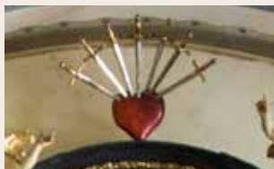
Bolestné Srdce Panny Marie na oltáři Ukřižování v kapli sv. Alžběty