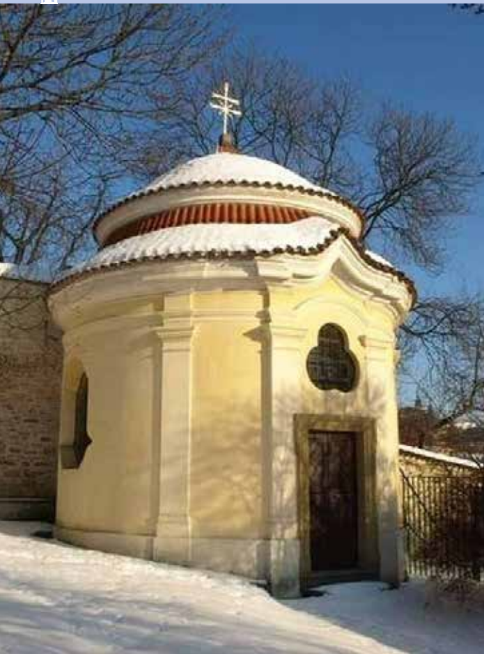
Kaple sv. Barbory.