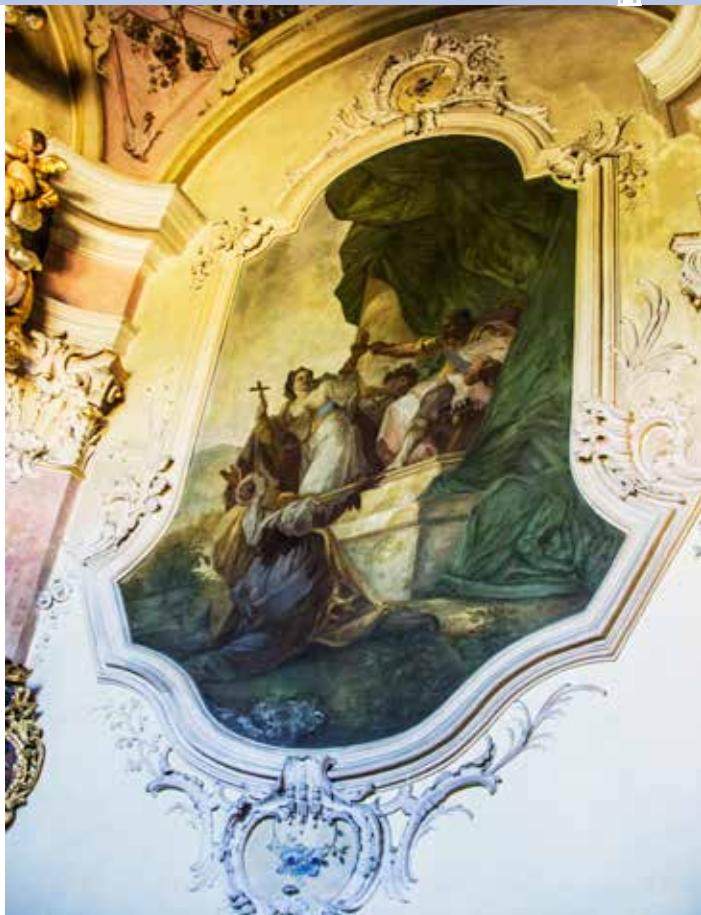
Freska Odmítání pohanských bohů na východní stěně kaple, v rámu odpovídajícím tvaru protějšního okna