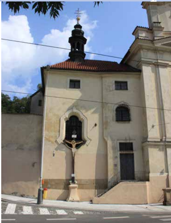
Průčelí kaple sv. Tekly. Levá část využila zdivo starší samostatně stojící zvonice