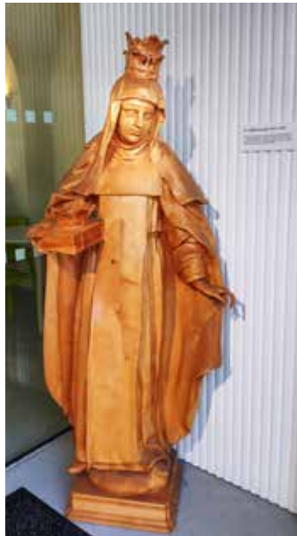
Socha sv. Alžběty v hlavním vchodu do nemocnice

Průčelí do ulice Na Slupi je řešeno velmi střídmě, okna jsou rámována stuhovými šambránami a fasádu člení pásové kordonové římsy. Střed fasády je zvýrazněn malým rizalitem, okno v patře tu doprovází dvě prázdné postranní niky a nad ním je umístěna deska s nápisem ZALOŽENO L. P. 1722 . Ve třetí nize v pravé části fasády stojí socha sv. Jana Nepomuckého.