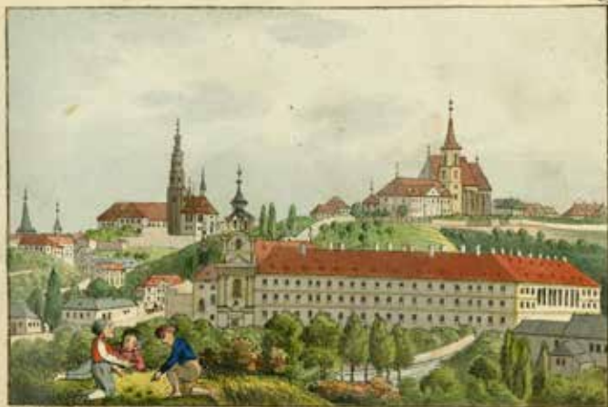
Das Elisabethens-Kloster mit St. Katharina u. St. Apollonia gegen Meissen Vielgl. Aug. Wenzl, Bismarckstraße in Prag

Klášter alžbětinek se sv. Kateřinou a sv. Apolinářem, A. Gustav, kolorovaný lept (kolem r. 1810), ze sbírky Muzea hl. m. Prahy Na této grafice vidíme velkou budovu kláštera a nemocnice alžbětinek s kostelem Panny Marie Bolestné od západu. Budovy jsou zde zobrazeny poněkud zjednodušeně, není tu zachyceno členění západní fasády. Přesto si můžete všimnout řady vysokých oken hlavního nemocničního sálu na jižní fasádě (vpravo).