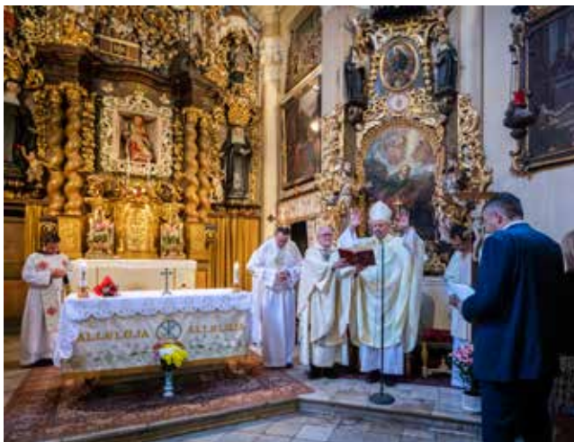
Mše svatá při příležitosti 300 let nemocnice sv. Alžběty 1. 6. 2022.

V současné době se připravuje koncepce rozvoje nemocnice a klášterního areálu. Uvažuje se o výstavbě nového křídla nemocnice při ulici Albertov, které by sloužilo jako stanoviště záchranné služby a také pro specializované ambulance a komplexní rehabilitační péči. Připravuje se také postupná obnova klášterních zahrad a návrat k původnímu účelu z doby jejich vzniku, kdy plnily nejen užitkovou funkci, ale byly i místem odpočinku i rozjímání, odkazujícím k Bohu a víře v něj.