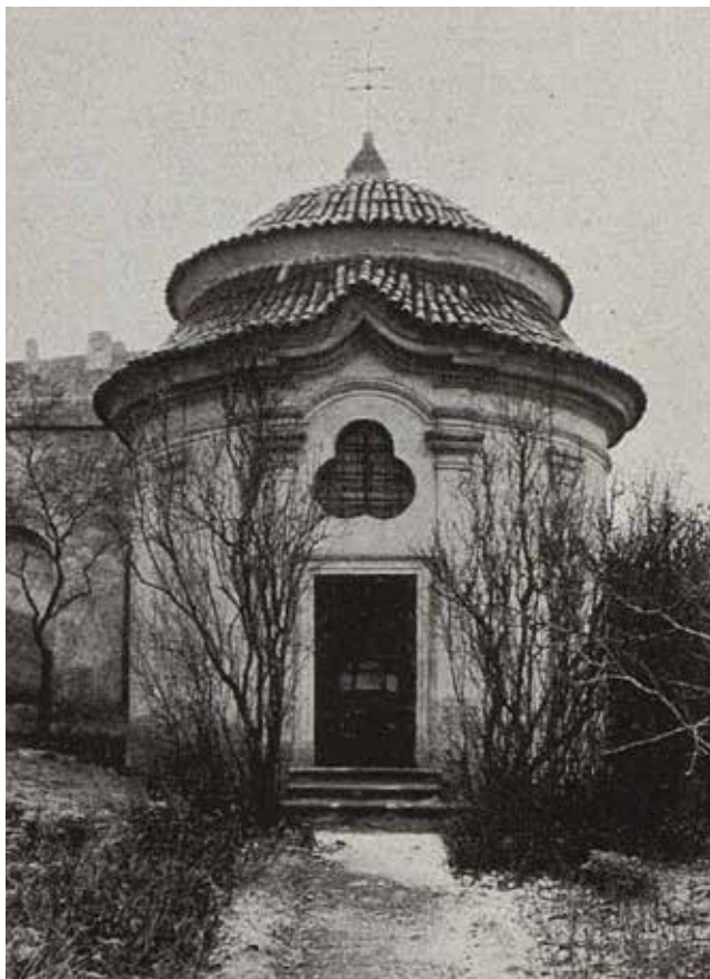
Barokní hřbitovní kaple sv. Barbory v zahradě kláštera.