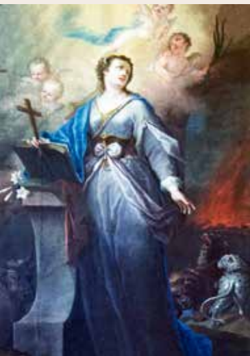
Světice na oltářním obraze v kapli sv. Tekly u kostela Panny Marie Bolestné

zena k smrti upálením, ale stal se zázrak a plameny uhasila náhlá bouře. Poté i s Pavlem z města uprchla a následovala jej na misijních cestách do Antiochie, kde byla opět zadržena, mučena a odsouzena k předhození divoké zvěři. Zde se odehrál druhý zázrak, zvěř ji odmítla roztrhat a Tekla opět smrti unikla. Nakonec se usadila v Seleucii na Sicílii, kde žila v jeskyni poustevnickým životem, léčila místní lidi a vzdělávala je v křesťanském učení až do své smrti ve věku 90 let. Podle jiné tradice se její život završil v Antiochii v Sýrii a ještě další legenda líčí, že se dostala až do Říma a našla věčný spánek vedle apoštola Pavla.