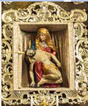
Socha Piety z doby kolem roku 1710 na hlavním oltáři

Jako jistý protiklad k sedmi bolestem se v katolické tradici připomíná také sedm radostí Panny Marie, jejichž výčet však není zcela ustálený.