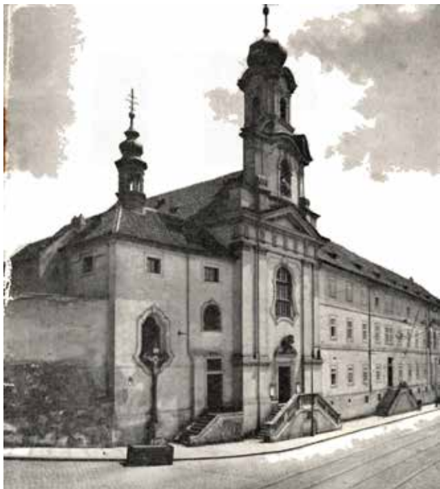
Pohled na kostel Panny Marie Bolestné v roce 1941.

V letech 1921–26 procházela nemocnice stavební rekonstrukcí a modernizací zdravotního vybavení. Byl zřízen nový operační sál, nové koupelny, zaváděn nový vodovod i kanalizace. 30. léta byla pro nemocnici obdobím velkého rozkvětu; zatímco v roce 1921 měla 60 lůžek, v roce 1933