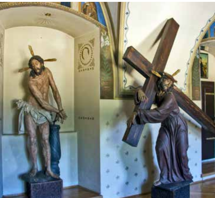
Barokní sochy pašijí pocházející původně z kláštera servitů: Kristus bičovaný, Kristus nesoucí kříž

V kapli stojí barokní oltář s obrazem Ukřižovaného a dále čtyři velké sochy pašijí z konce 17. století, přenesené sem z bývalého sousedního kláštera servitů po jeho zrušení za josefinských reforem: Kristus modlící se na hoře Olivetské, Kristus připoutaný ke sloupu a bičovaný, Kristus korunovaný trním (Ecce homo) a Kristus nesoucí kříž.