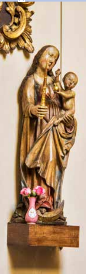
Pozdně gotická socha Panny Marie s Ježíškem na severní stěně lodi

Rokoková kazatelna pochází z doby kolem poloviny 18. století. Řečniště je zdobeno čtyřmi andílky, kteří nesou symboly čtyř církevních Otců; tři sedí na římse před zábradlím řečniště, čtvrtý na vrcholku baldachýnu nad kazatelnou.