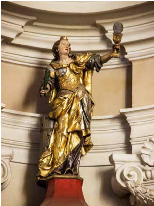
Socha sv. Barbory stojící na vrcholku oltáře sv. Anny. V levé ruce drží kalich s hostií, v pravé ruce palmovou ratolest jako symbol mučednictví