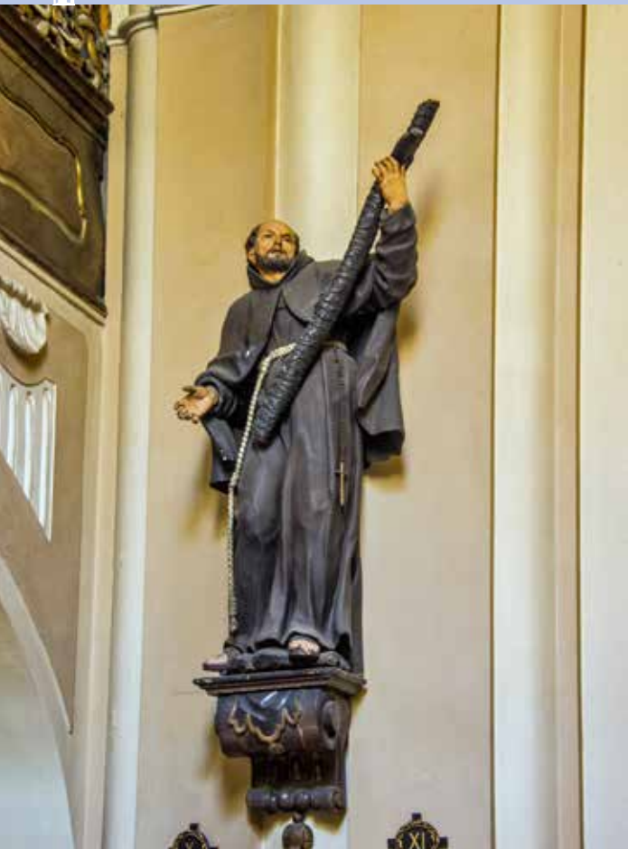
Socha sv. Petra z Alkantary