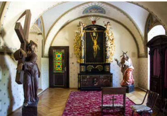
Kaple sv. Alžběty

Původními barokními dveřmi z lodi kostela je naproti kapli sv. Tekly přístupná kaple sv. Alžběty, umístěná v krátkém spojovacím křídle mezi kostelem a budovami kláštera a nemocnice. Je to nízká klenutá místnost, vyzdobená nástěnými malbami z konce 19. století. Ústředním motivem je stropní malba sv. Alžběty v mandorle s citátem z knihy Přísloví: OTEVŘELA NUZNÝM DLAŇ SVOU A VZTÁHLA RUCE SVÉ K CHUDÝM – NEPOŽÍVALA V ZAHÁLCE CHLĚB SVŮJ. (Př 31:20,27). Další nástropní malby zobrazují Pannu Marii Ochránkyni a Ježíše Krista. Plochy nad výklenky v delších stěnách kaple jsou pak vyzdobeny malbami světců a výjevů ze života sv. Alžběty.